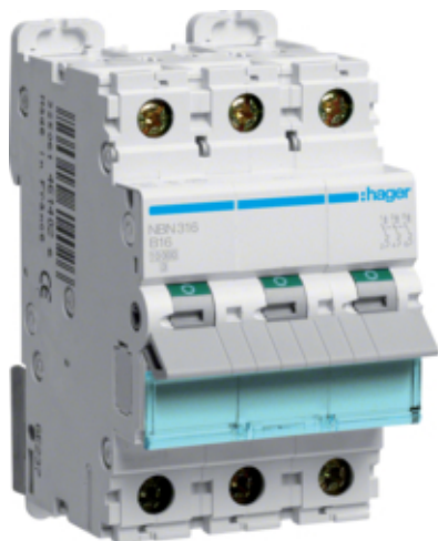
Jistič 3 pól. 16A, char.B, 10 kA