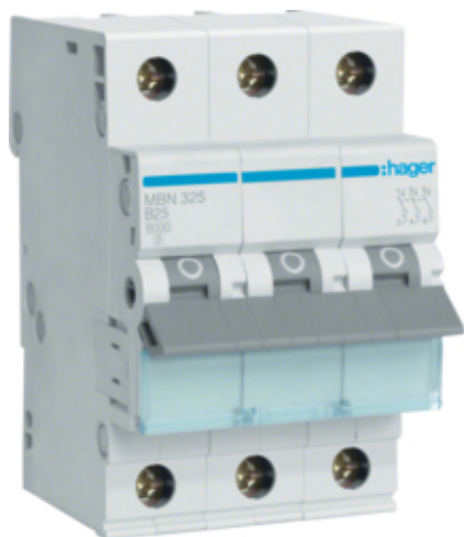
Jistič 3 pól. 25A, char.B, 6 kA