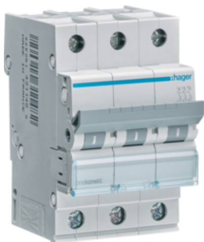
Jistič 3 pól. 20A, char.C, 6 kA